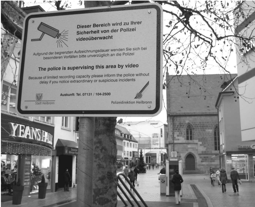
Abb. 1: Videüberwachung in der Heilbronner Fußgängerzone

stungen verknüpfen oder aber im „Revierdienst“ – so die Bezeichnung im Sicherheitsgewerbe – zwischen mehreren Wohnblocks patrouillieren. In ostmittel-europäischen Metropolen wie Warschau werden neue Apartmentgebäude fast durchweg von privaten Sicherheitsdiensten überwacht (GLASZE u. PÜTZ 2004a).